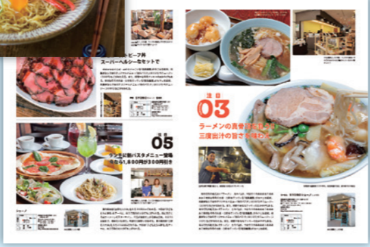
※誌面はイメージです