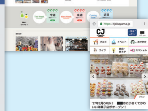
※画像はすべて開発中のものです

■「今日何する?」「週末どこ行く?」をキーワードに、忙しい生活者のニーズを満たすタイムリーな情報をお届けします。